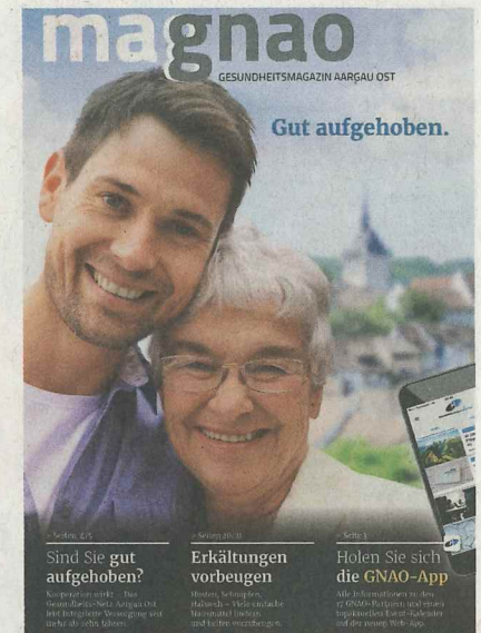
Das Gesundheitsmagazin «magnao»

Das Gesundheits-Netz Aargau Ost wurde 2007 auf die Initiative des Kantonsospitals Baden gegründet und hat zum Ziel die 17 Partnerinstitutionen gewinnbringend miteinander zu ver-